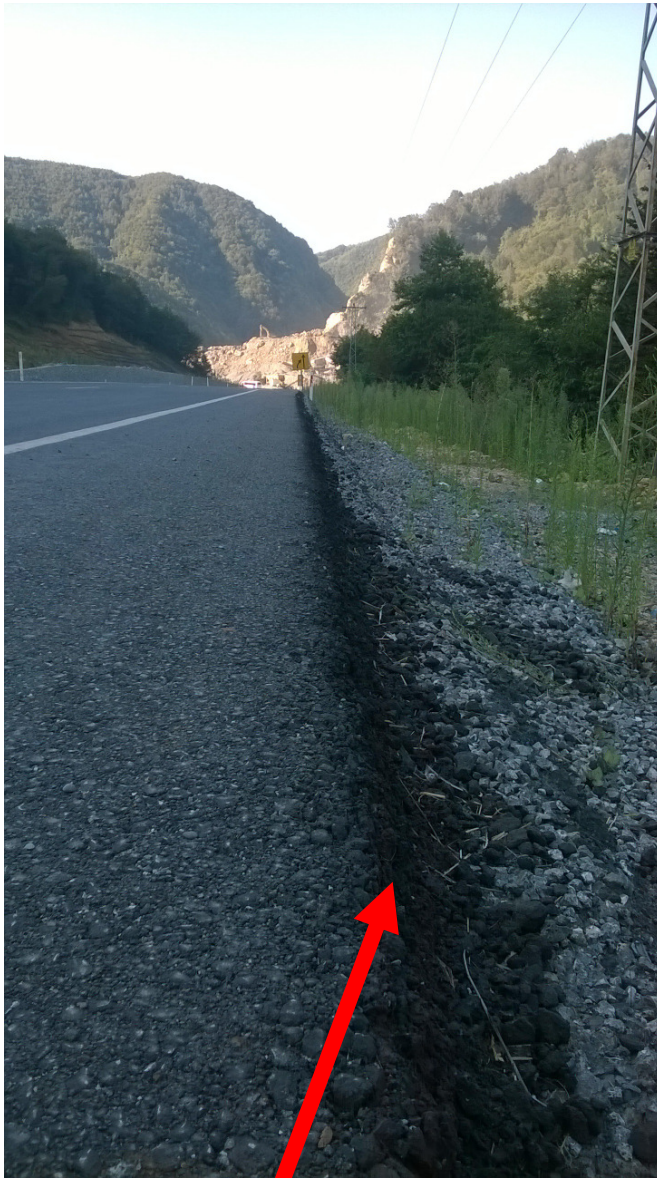
durchaus taugliches Meditationskissen

teilweise in sehr schlechtem Zustand, mitunter eine Baustelle, und einmal musste ich sogar eine halbe Stunde warten, bis eine unpassierbare Stelle (mit 150 Steilhang zum Meer) so weit ausgebessert war, dass wieder Autos darüber fahren konnten.