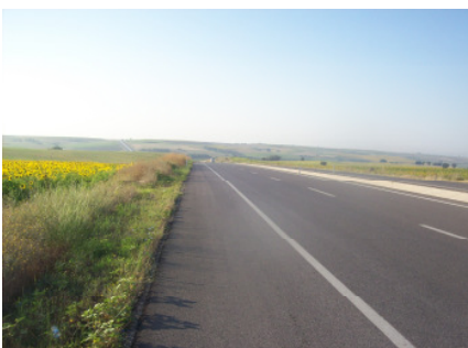
Pilger (oben) und der Pfad (unten)

Natürlich sind auch Fragen und Diskussionsbeiträge erwünscht. Zum Abschluss werden wir einige Mantras rezitieren.