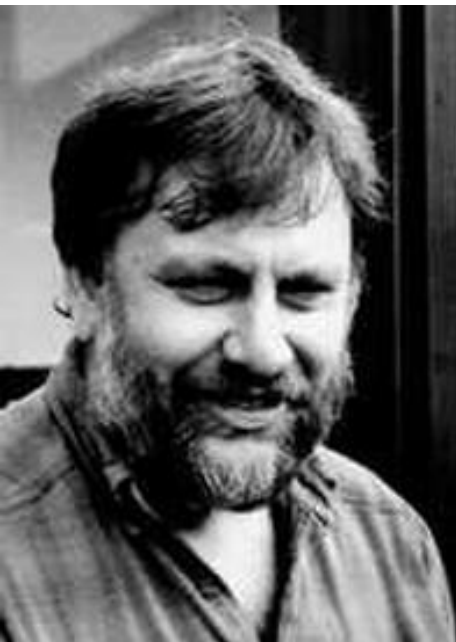
Kritisiert den Westlichen Buddhismus: der international renommierte slovenische Philosoph und Psychoanalytiker Slavoj Zizek

Bei aller derzeitigen Offenheit der westlichen Welt gegenüber dem Buddhismus, die grundlegende Ich-Orientierung ist dort in keiner Weise verschwunden, sondern reinkarniert sich nur in neuer Gestalt: im Konzept der konsumfreudigen Selbstverwirklichung, der marktwertbewussten Ich-Inszenierung, des psychologischen und biotechnischen Persönlichkeitsdesigns. Es geht längst nicht mehr um die christliche "Vervollkommnung der Seele" sondern um das erfolgreiche Coming out als Ich-AG. Wo die Ökonomie zur eigentlichen Religion wird, werden wir zu Produzenten und Verkäufern unser selbst als Ware – unseres "hart erarbeiteten" Selbst – auf einem grenzenlosen Markt der Ich-Konkurrenz. Die eigene Person wird zur Aktiengesellschaft, das Leben zum Gewinn- oder Verlust-Geschäft. Umgekehrt wird die Religion immer mehr zur Ökonomie, zum religiösen Supermarkt und Business.