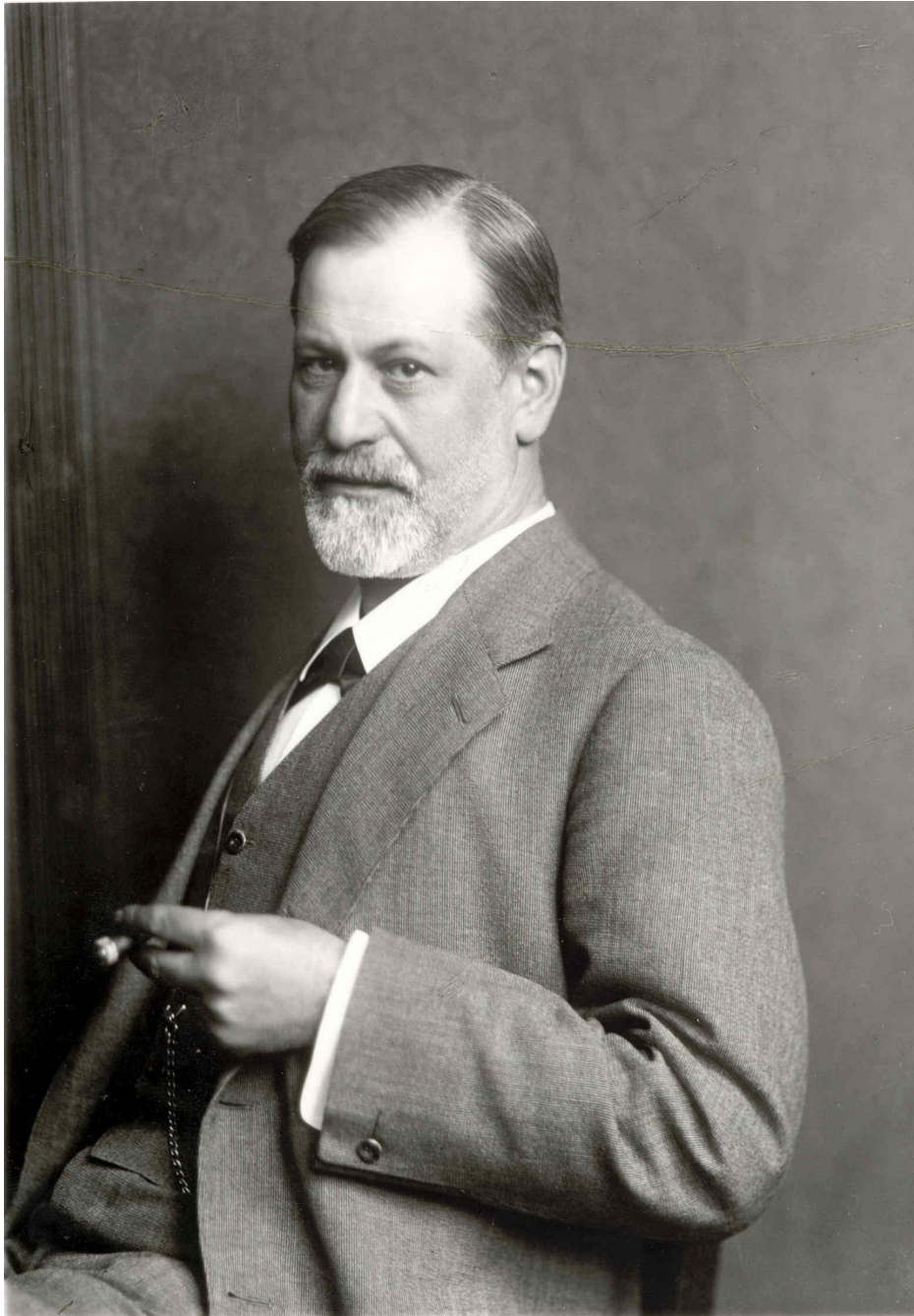
Sigmund Freud - spätestens seit ihm hat sich das westliche Denken von der "ewigen Seele" emanzipiert - den Buddhisten ist es nur nicht aufgefallen.

Auch unter den ernsthafteren westlichen Buddhisten wird die neuartige Verkleidung des Ich-Konzepts kaum wahrgenommen oder durchschaut. Stattdessen klebt die gängige Vermittlung der Lehre vom Nicht-Ich (anatta) an der Widerlegung alttümlicher Konzepte wie dem von der "Ewigen Seele". Darüber ist das westliche Denken aber spätestens seit Sigmund Freud hinaus. Die Soziologie, Psychologie, Neurologie haben die Idee von einem dauerhaften Selbst schon lange aufgegeben. Sie sprechen heute von der flexiblen, multiplen, in Entwicklung befindli-