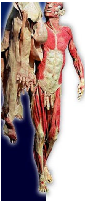
Tabuverletzung ist Kult und cool. Hier ein Exponat aus Gunter von Hagens Leichenshow.

Unsere gesellschaftliche Wirklichkeit macht uns die Ausübung der Dharmapaxis wahrlich nicht leicht. In buddhistischen Ländern, die zumeist viel ärmer sind als wir, ist das noch immer viel einfacher. Und das hat nicht nur mit unserer christlichen