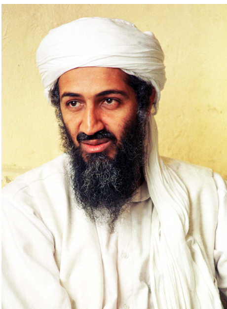
Auch das Netzwerk des Terrors ist zu einem globalen Phänomen geworden, hier sein Markenzeichen.

Auch hier gibt es den Gegenpol. Zur Zeit ist viel vom globalen "Netzwerk des Terrors" die Rede. Und zahlreiche weitere kriminelle Aktivitäten sind ebenfalls weltweit vernetzt: der Drogenhandel, der Frauenhandel, der neue Sklavenhandel, der Handel mit menschlichen Ersatzorganen oder Embryonen oder mit Waffen, wie z. B. jenen Massenvernichtungswaffen. Und nicht selten sind diejenigen, die das offiziell bekämpfen, selbst an diesen Netzwerken und Machenschaften beteiligt.