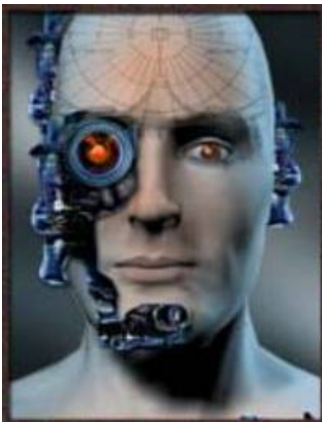
Ein Cyborg. - Sieht so der Sieg über Alter, Krankheit und Tod aus?

fekten und unsterblichen Kunstmenschen. Es geht um die technische Befreiung des Menschen von Leid. Stichworte dafür sind der Cyborg