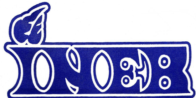
International Network of Engaged Buddhists

Und eine vierte Gruppierung war mir noch aufgefallen, allerdings schien von denen niemand da zu sein, besonders fand ich deren Namen inspirierend: Freunde des Westlichen Buddhistischen Ordens, FWBO. Ich suchte den Dharma, nicht das Exotische. Eine Bach-Kantate spricht mich mehr an als tibetischen „Katzenmusik“. Ein barockes Vanitas-Gemälde vermittelt mir mehr das Gefühl von Vergänglichkeit als ein asiatischer Thangka. Daher: ein westlicher Buddhismus, das erschien mir höchst attraktiv.